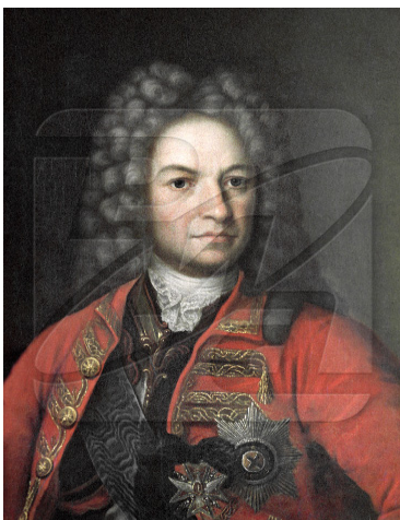
Неизвестный художник. Портрет генерал-фельдмаршала Я. В. Брюса