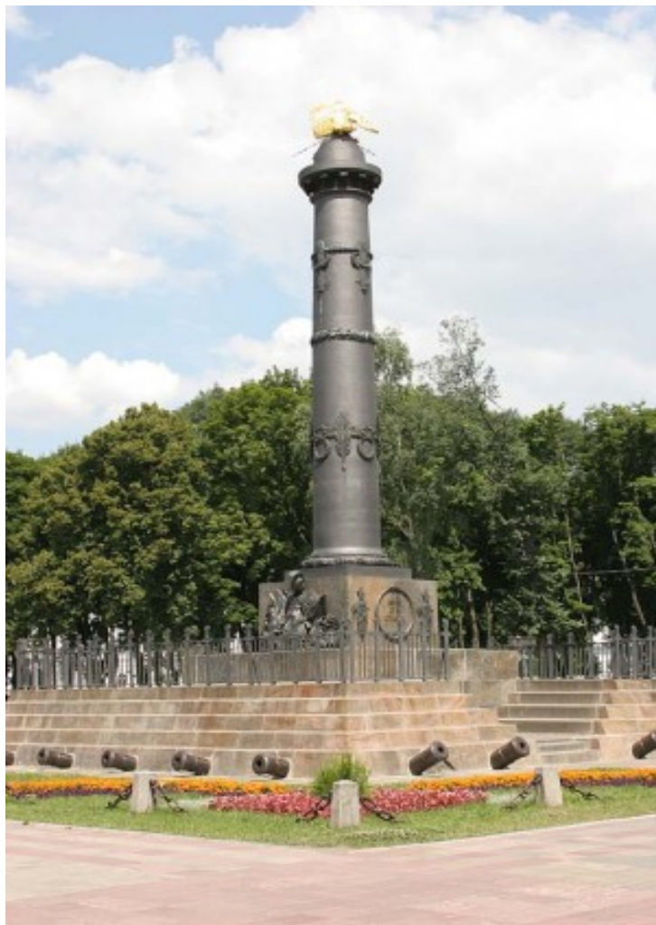
Монумент Славы в честь победы русского войска в Полтавской битве. Проект академика Т. Томона, скульптор Ф. Щедрин, архитектор М. Амвросимов