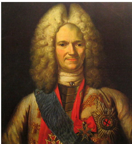
Неизвестный художник. Портрет генерал-фельдмаршала А. Д. Меншикова