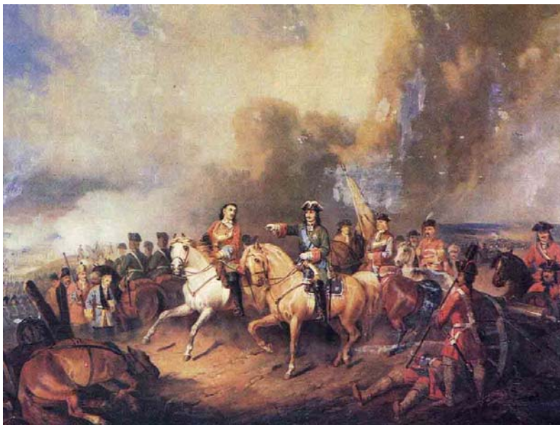
Виллевалде Б. П. Полтавская битва