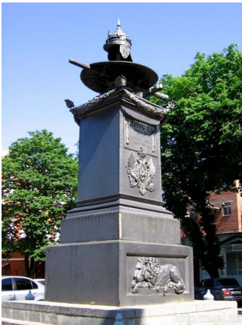
Памятник на месте отдыха Петра I после Полтавской битвы. Проект архитектора А. Брюллова