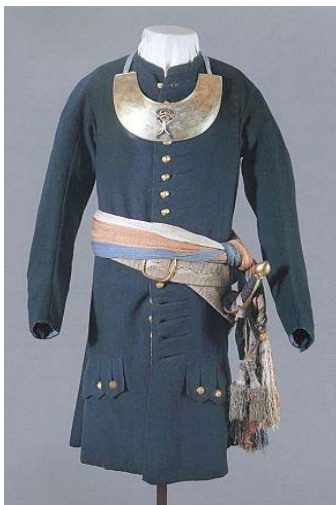
Камзол императора Петра I, бывший на нём в день Полтавского сражения 20 июня 1709 г.