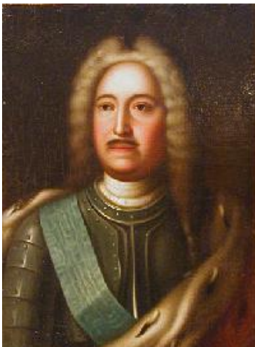
Неизвестный художник. Портрет генерал-фельдмаршала М. М. Голицына