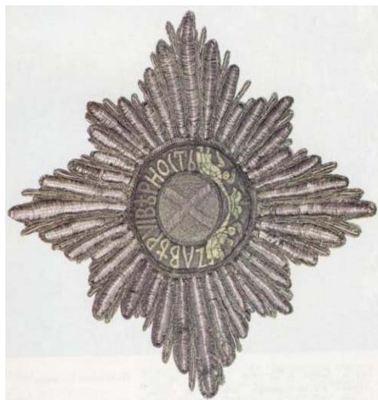
Звезда ордена св. Андрея Первозванного Я. В. Брюса, награжденного за отличие в Полтавском сражении