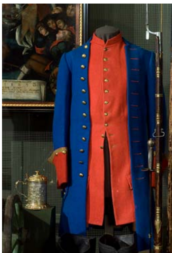
Мундир рядового лейб-гвардии Семеновского полка. Ружье кремневое со штыком. Кружка генерал-фельдмаршала Б. П. Шереметева