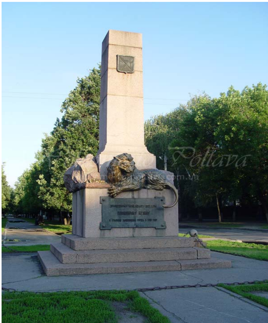
Памятник коменданту крепости Полтава полковнику А. С. Келину. Скульптор А. Обер, архитектор А. Бильдерлинг