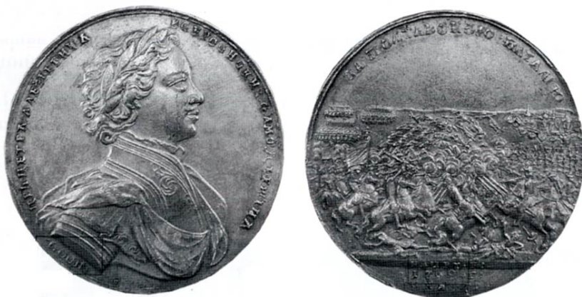
Гуэн С. и Хаупт Г. Наградная унтер-офицерская медаль за сражение при Полтаве