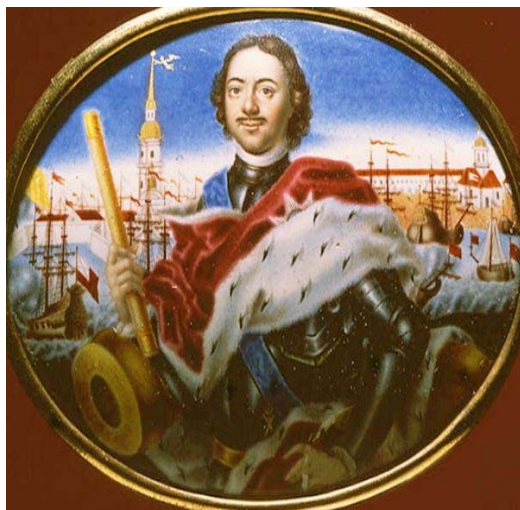
Купецкий Я. Петр I, 1711 г.