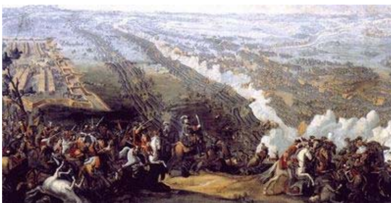
Мартен Д. Полтавская битва