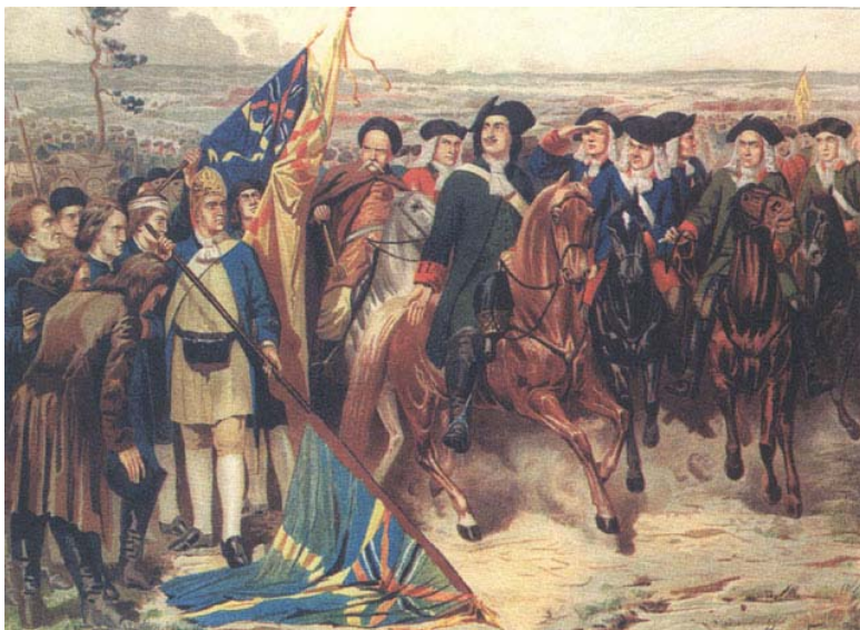
Кившенко А. Полтавский бой