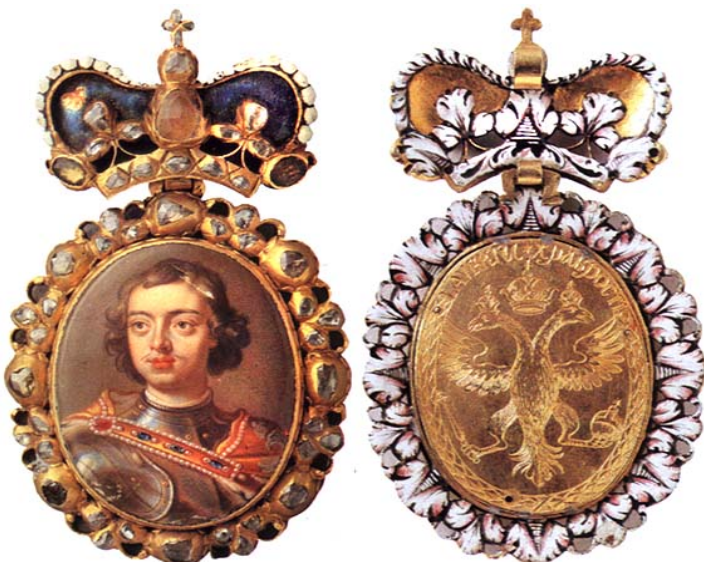
Наградной портрет Петра I, выдававшийся за военные заслуги