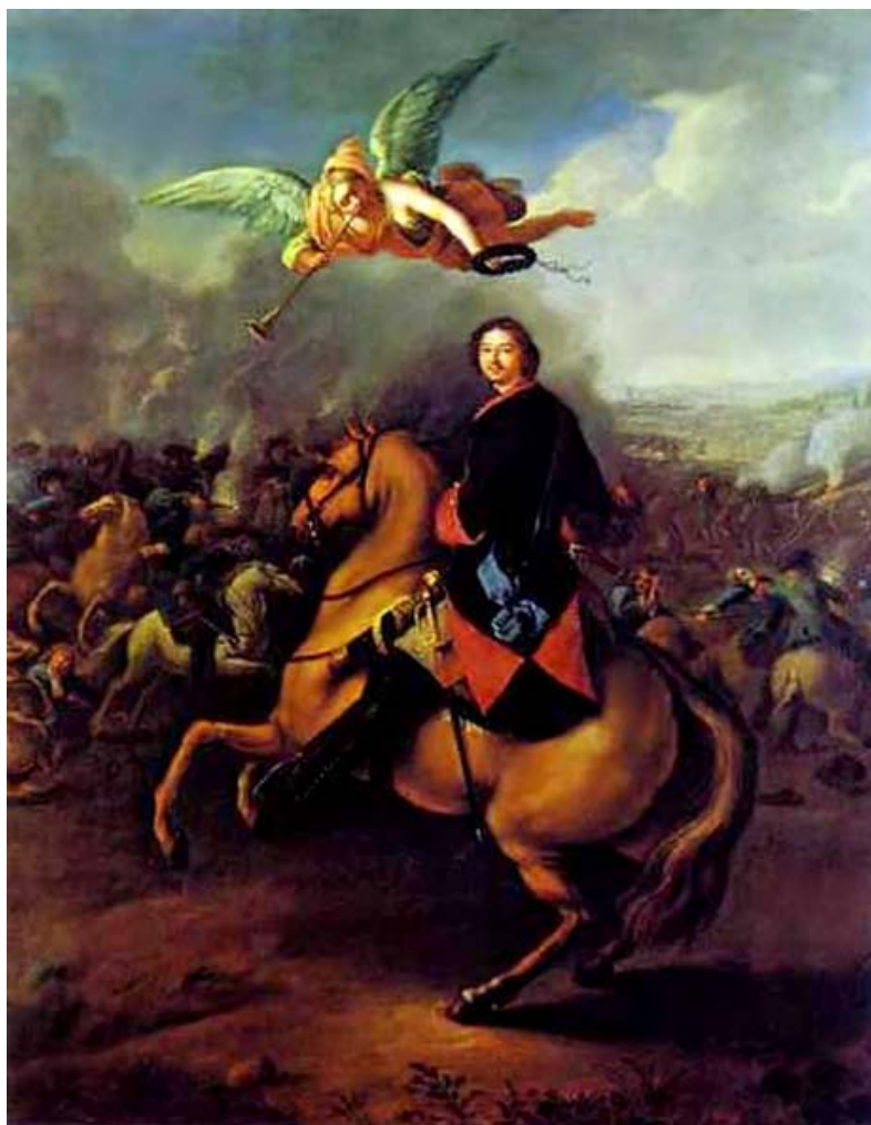
Таннауэр И. Г. Петр I. Полтавская битва