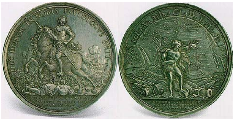
Мюллер Ф. Медаль в память победы русских войск в битве при Полтаве