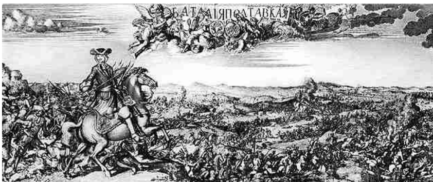
Пикарт П. Полтавская битва 1709 г.