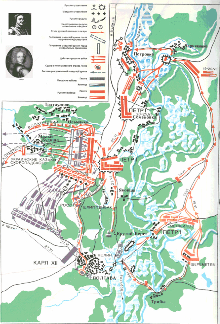
Полтавская битва, 27 июня по стар. ст. 8 июля по новому ст. 1709 г