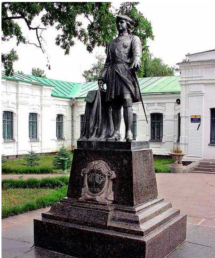
Памятник Петру I перед музеем Полтавской битвы. Скульптор А. Адамсон, архитектор Д. Вероцкий