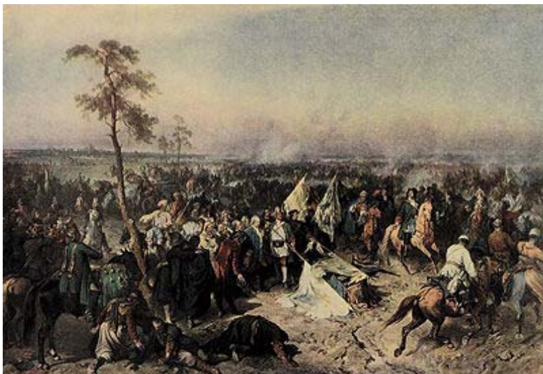
Коцебу А. Е. Полтавская победа