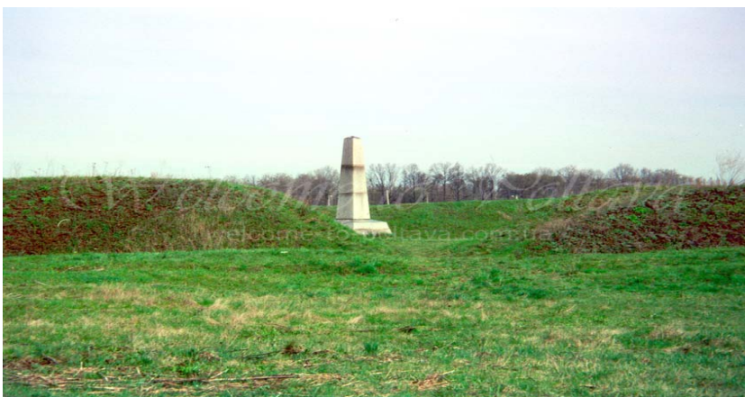
Редуты на поле Полтавской битвы