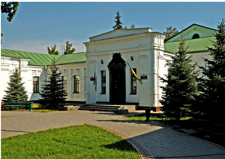
Музей истории Полтавской битвы