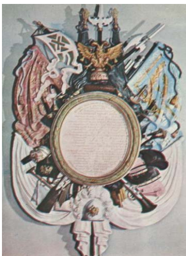
Картуш с наименованием полков, принимавших участие в Полтавской битве