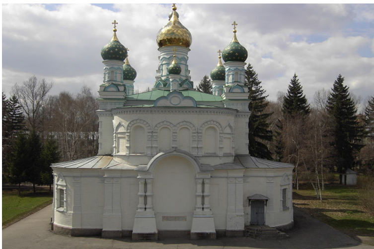
Сампсониевская церковь на месте Полтавской битвы. Построена в 1856 году по проекту архитектора Й. И. Шарлеманя