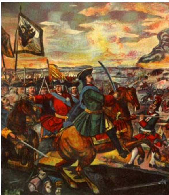
Ломоносов М. В. Полтавская баталия. Фраг. мозаики