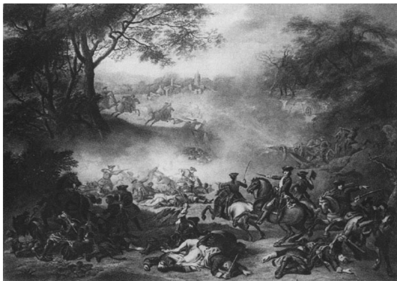
Натъе Ж. Полтавский бой