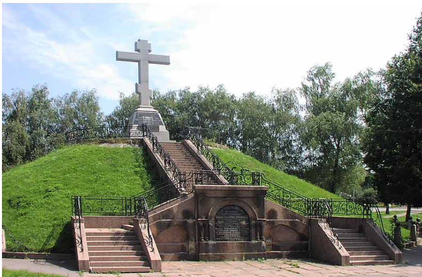
Памятник погибшим в Полтавской битве. Братская могила русских воинов. Архитектор Н. Никонов, мастер А. Баринов