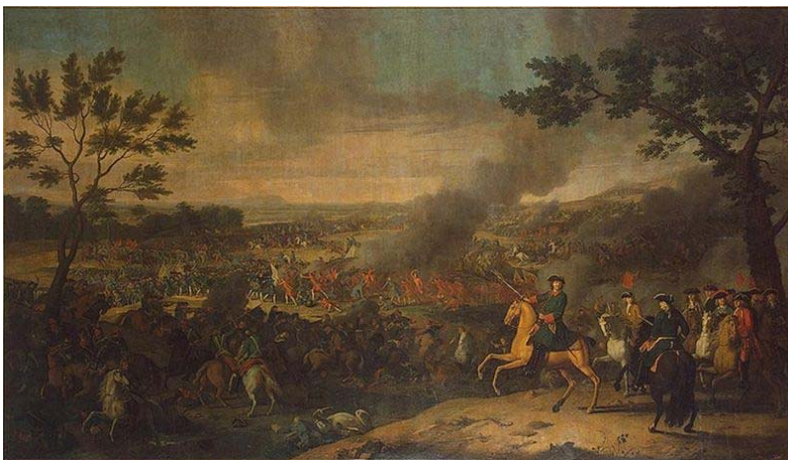
Каравак Л. Петр I в Полтавской битве