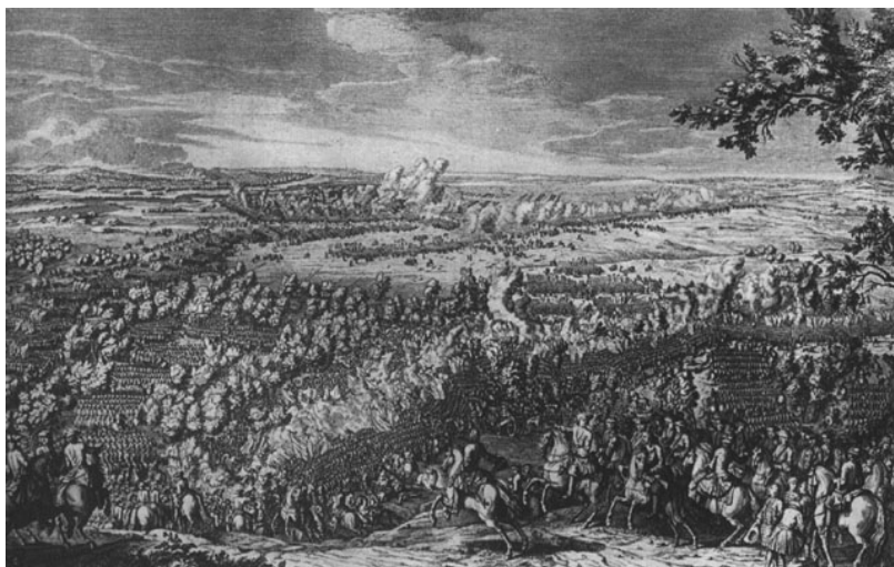
Симоно Ф. Полтавская баталия