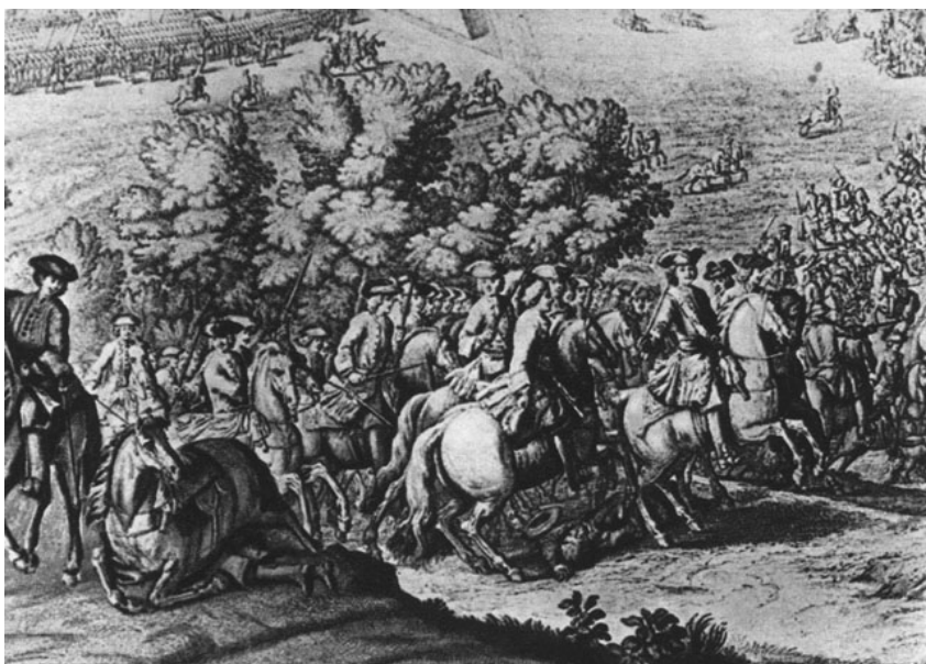
Лармессен Н. Петр I во время Полтавской битвы