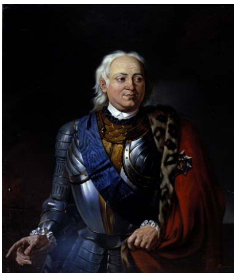
Неизвестный художник. Портрет адмирала Ф. М. Апраксина