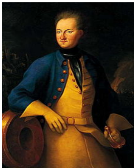
Спарре А. Портрет Карла XII, 1712 г.