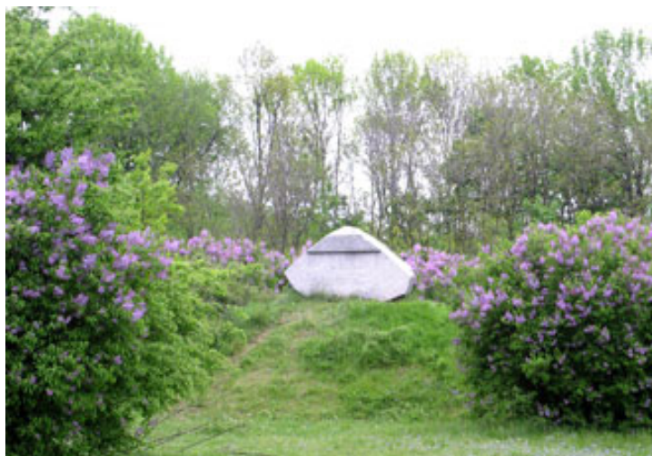
Лагерь русской армии у деревни Яковцы