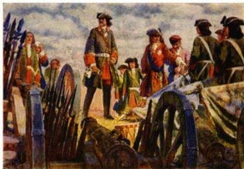
Лансере Е. Е. Полтавская битва